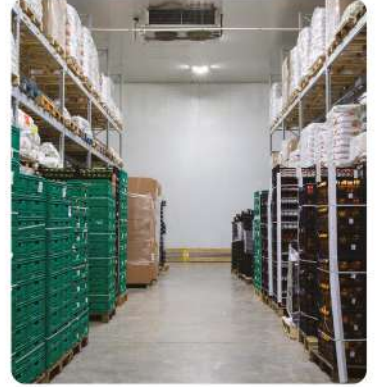
Narenciye ve Muz Sarartma Soğuk Hava Depoları (Citrus and Banana Yellowing Cold Storage Tanks)