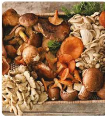
Mantar Çiftliği Soğuk Hava Deposu (Mushroom Farm Cold storage)