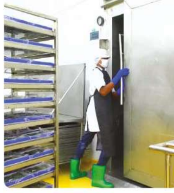
Et ve Balık Soğuk Oda Depoları (Meat and Fish Cold Room Warehouses)