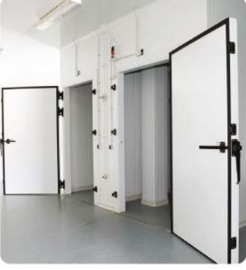
Yoğurt Soğuk Hava Deposu (Yogurt Cold Storage)