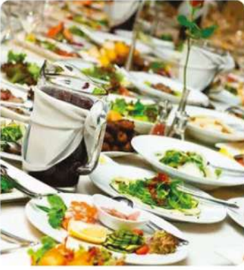
Catering Soğuk Hava Depoları (Catering Cold Storage Facilities)