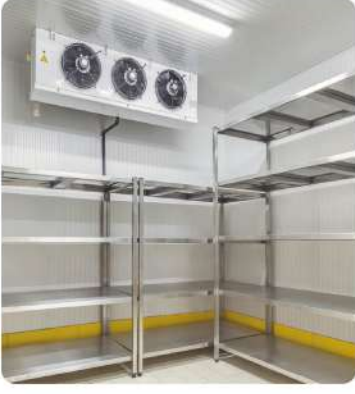
Pasta ve Unlu Mamuller İşletme Soğuk Hava Deposu (Pastry and Bakery Products Operating Cold Storage)