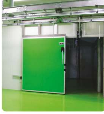
Hastane Tibbi Atık Soğuk Hava Deposu (Hospital Medical Waste Cold Storage)