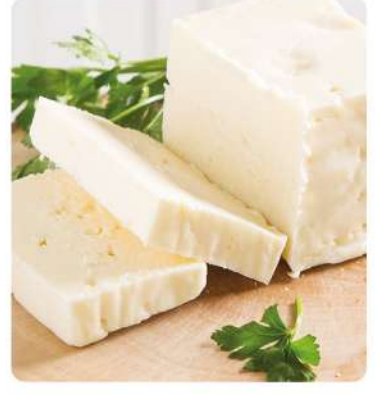
Peynircilik Soğuk Hava Deposu (Cheesemaking Cold Storage)