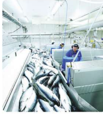
Balık İşleme ve Depolama Soğuk Hava Deposu (Fish Processing and Storage Cold Storage)