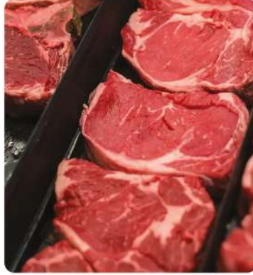
Kırmızı Et Soğuk ve Donmuş Muhafaza Odaları (Red Meat Cold and Frozen Storage Rooms)