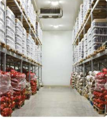
Tarım Ürünleri Soğuk Hava Depoları (Agricultural Products Cold Storage Facilities)