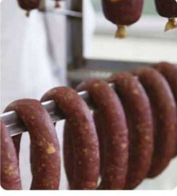
Sucuk Fabrikası Soğuk Hava Deposu (Sausage Factory Cold Storage)