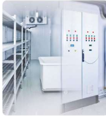
Süt Ürünleri İşleme Soğuk Hava Deposu (Dairy Products Processing Cold Storage)