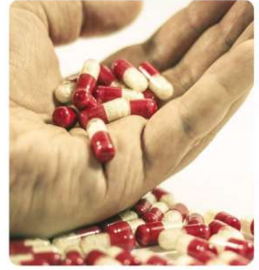
İlaç Soğuk Hava Deposu (Pharmaceutical Cold Storage)