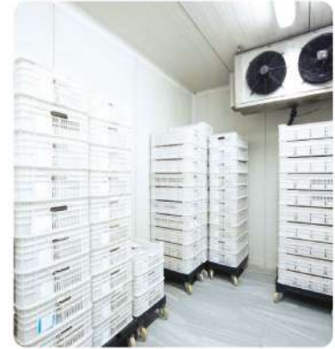
Hazır Gıda İşleme Soğuk Hava Deposu (Ready-Made Food Processing Cold Storage)