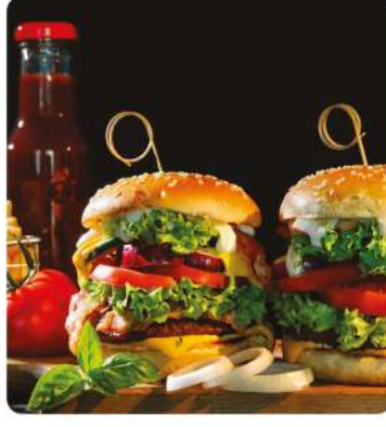
Hazır Yemek Soğuk Hava Deposu (Ready-to-Eat Cold Storage)