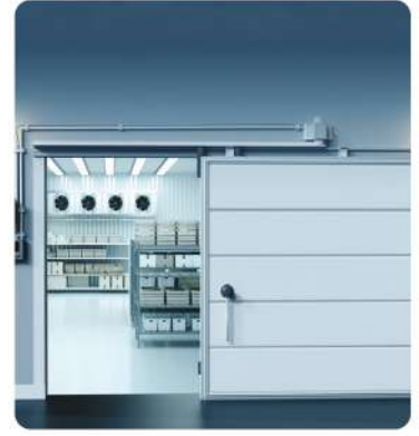
Kafeterya Restaurant Soğuk Hava Deposu ve Donmuş Muhafaza Odası (Cafeteria Restaurant Cold Storage and Frozen Storage Room)