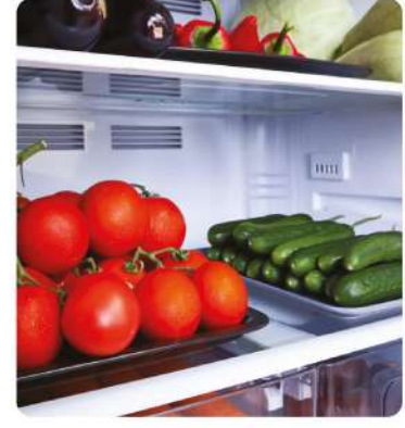
Meyve ve Sebze Soğuk Hava Depoları (Fruit and Vegetable Cold Storage Facilities)