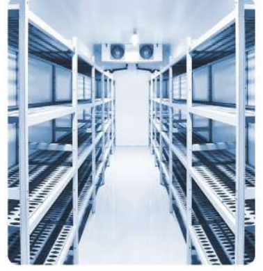
Pastane Ürünleri Soğuk Hava Deposu ve Donmuş Muhafaza Odası (Patisserie Products Cold Storage and Frozen Storage Room)