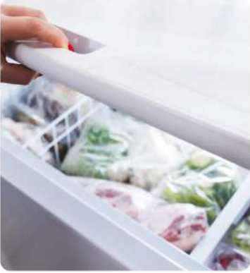
Gıda Şoklama ve Donmuş Muhafaza Odaları (Food Quenching and Frozen Storage Rooms)