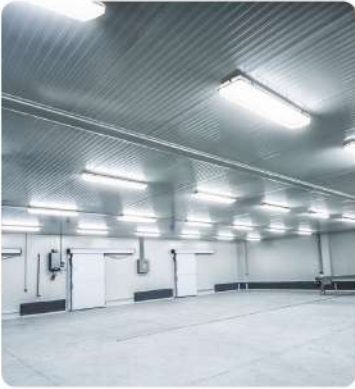
Tavuk İşleme Soğuk Hava Deposu (Chicken Processing Cold Storage)