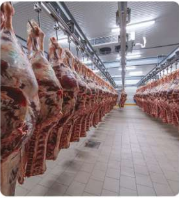
Yemek Fabrikası Soğuk Hava Deposu (Food Factory Cold Storage)