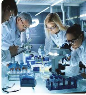
Tıbbi Kimyavevi Ürünler Soğuk Hava Deposu (Medical Chemical Products Cold Storage)