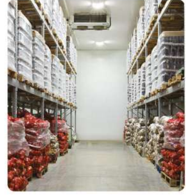
Patates Soğan İşleme Soğuk Hava Deposu (Potato Onion Processing Cold Storage)