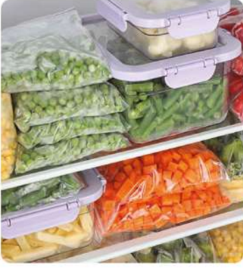
Yaş Sebze ve Meyve İşleme Soğuk Hava Deposu (Fresh Vegetable and Fruit Processing Cold Storage)