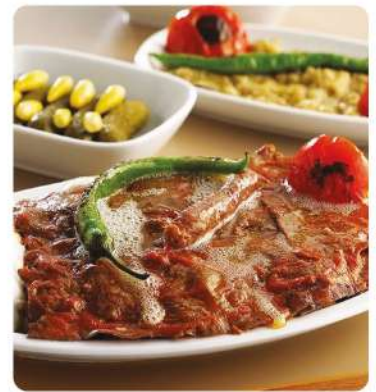
Et Lokantası Soğuk Hava Deposu (Steakhouse Cold Storage)