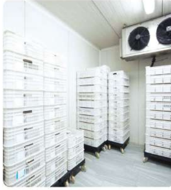
Balıkçılık Soğuk Hava Deposu (Fishing Cold Storage)